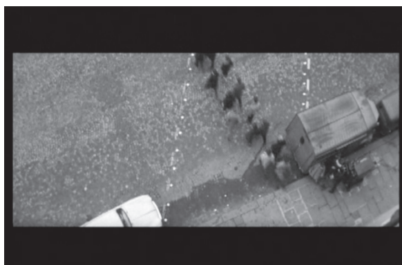
Figura 4 – Fotograma do filme

Passo agora a narrativa do fragmento que é um momento de desconstrução do próprio fragmento, um momento que antecede a interpretação. A cena inicia-se com um fade in 22 . O professor de “educação física” sai da escola, ultrapassa uma porta de entrada, e na sequência um portão de grade, na boca um apito que não cessa de apitar e os movimentos iniciais de uma corrida; o plano aberto no professor vai se fechando na tela, os alunos vão aparecendo na imagem, o professor está de calção e com um moletom, atrás do professor os meninos da turma de Antoine Doinel seguem o professor em fila, os dois primeiros seguram uma bola. O professor fica ao lado do portão, próximo da grade, os movimentos incessantes continuam e o apito também, os meninos estão todos vestidos com casacos, calças compridas e sapatos, e vão passando pelo professor, que se movimenta – ansiosamente – para o outro lado e faz gestos com as mãos para que todos os meninos o ultrapassem e comecem a correr pelas ruas de Paris.