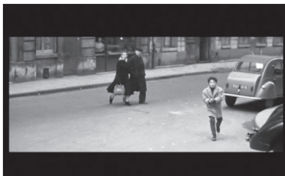
Figura 3 – Fotograma do filme

Quando Truffaut escreveu o argumento do seu filme não tinha em mente que estaria colocando questões para a Educação Física, e tão pouco imaginaria que seu filme estabeleceria conexões como os saberes fazeres que estão presentes neste campo de conhecimento, e também não é nossa intenção e seria muito equivocado entender o filme através do campo da Educação Física. Entretanto, o filme tenciona nossas noções de tempo e espaço, pois o tempo que está no passado do filme se coloca no presente vivido quando é visto por alguém, e as questões espaciais e temporais visíveis na obra cinematográfica se deslocam no espaço tempo que está no presente, assim como as questões culturais presentes na produção do filme. O que quero dizer com isso é que o filme preserva um espaço tempo , mesmo que esteja distante, pois as fronteiras são ruínas na película. Nesta ruína produzida pelos efeitos da assistência da produção somos colocados novamente em movimento com nossos sentidos e significados, tanto no presente do filme, no passado do filme e no futuro do filme 21 , aquilo que pensamos, que vivemos e sentimos estão aflorados na frente das imagens na sala escura.