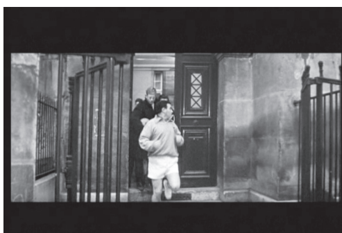
Figura 1 – Fotograma do filme