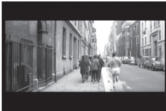
Figura 2 – Fotograma do filme