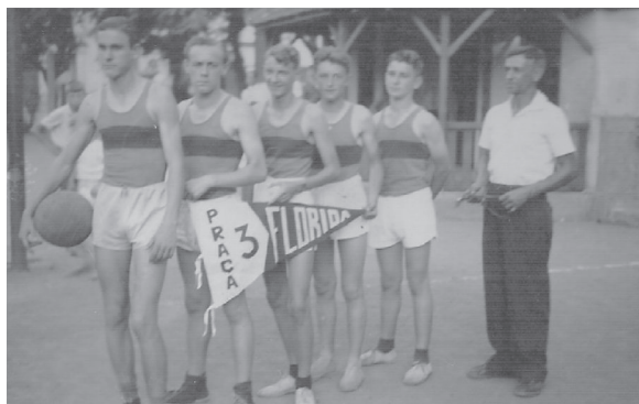
Ilustração 3. Club de Basquetebol da Praça nº 3 Florida.

Imagens encontradas dos clubs formados nas praças chamaram-nos a atenção para alguns detalhes. Os integrantes perfilados seguravam as flâmulas que, com as inscrições “Praça número 2” e “Praça número 3”, delimitam seu espaço. Percebe-se que aquela ação registrada nas fotografias deixava saber as seguintes informações: a que ou a quem eles representavam; quem eram; de onde vinham; e por quem jogavam. Chartier (1990, p. 20) expõe-nos uma das funções da representação como “exibição de uma presença, como apresentação pública de algo”; e é nesse sentido que os clubs das praças e suas práticas, enquanto atividades sociais produtoras de significados e sentidos, revelavam-se independentes e providos de uma lógica inerente ao contexto social em que eram produzidas (WAGNER, 1998).