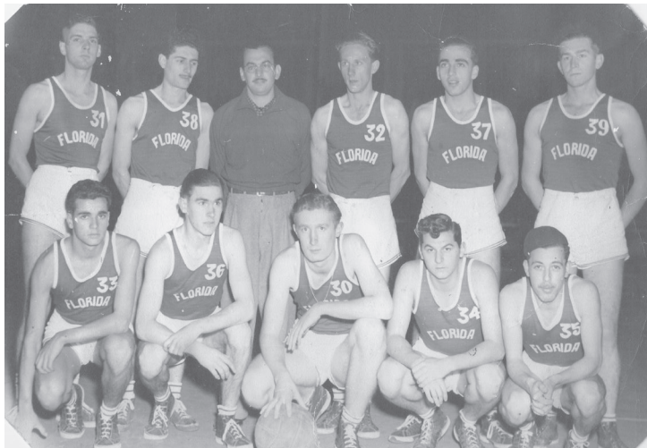
Ilustração 5. Equipe do Florida Atlético Clube, Praça Florida.

Na visão dos reclamantes, o ideal seria a realização de campeonatos entre praças, sagrando-se campeãs das competições equipes que nelas fossem formadas; e, principalmente, que os “clubinhos” tivessem liberdade para frequentar e utilizar os equipamentos da praça. O que podemos constatar é que, mesmo após essa reclamação formal veiculada no jornal da cidade, os campeonatos e torneios nas praças multiplicavam-se. Encontramos várias notas de jornais registrando o excelente desempenho dos rapazes da Praça A ou das senhoritas da Praça B nas competições.