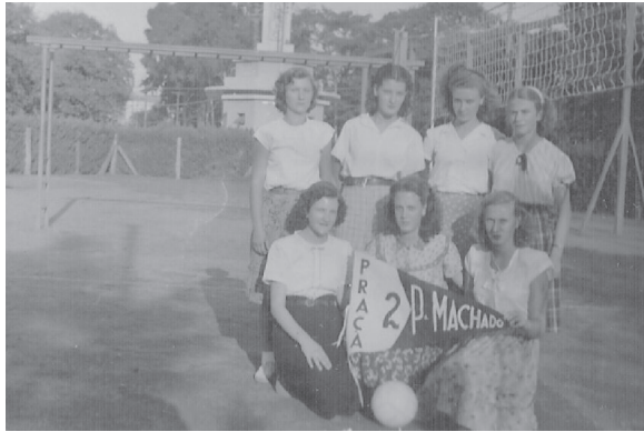
Ilustração 4. Club de Voleibol da Praça nº 2 Pinheiro Machado.