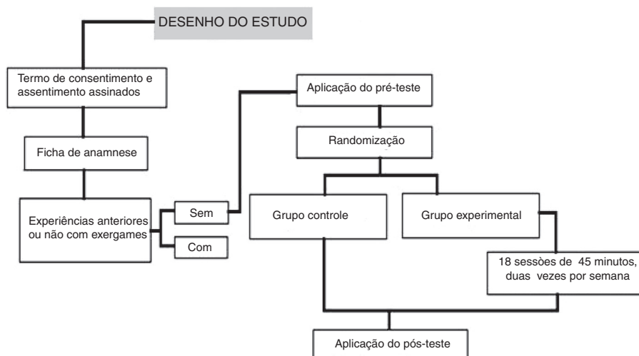
Figura 1 Fluxograma do desenho do estudo.

As avaliações foram feitas em ambiente escolar, longe de interferências e que propiciassem maior atenção durante